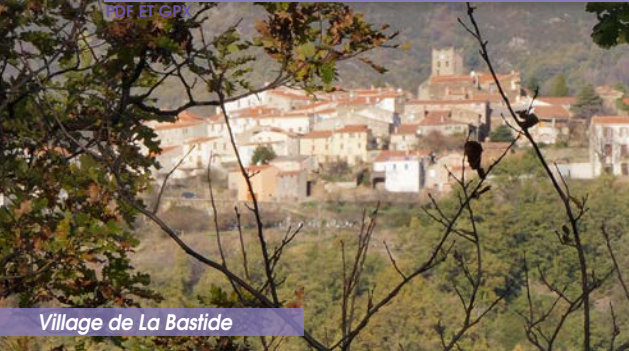
Village de La Bastide