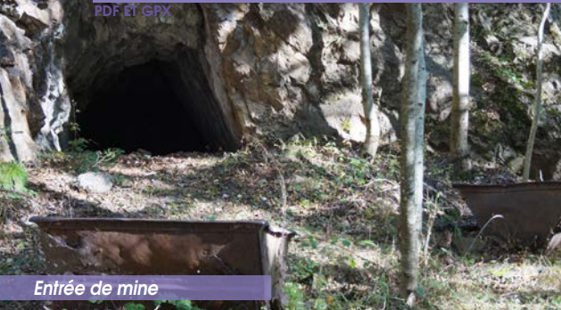
Entrée de mine