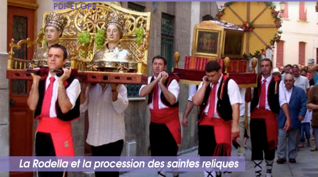
La Rodella et la procession des saintes reliques