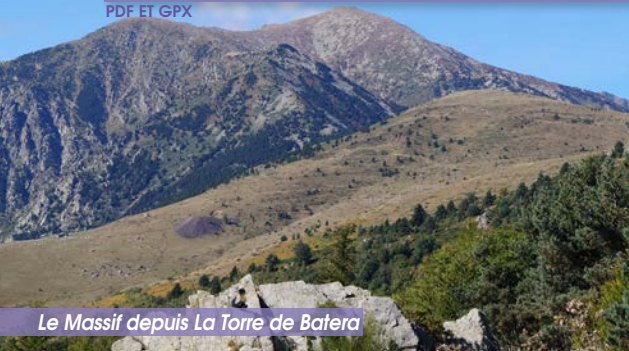
Le Massif depuis La Torre de Batera