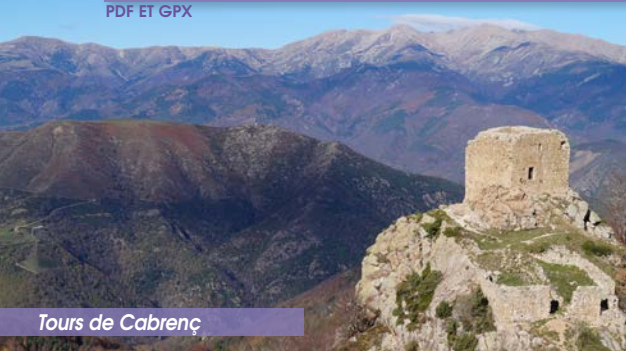
Tours de Cabrenç