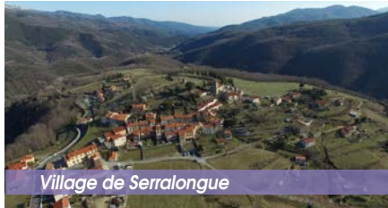
Village de Serralongue

C'est un magnifique village du Vallespir. Vous y trouverez un remarquable petit musée avec des vitrines animées expliquant le travail du fer catalan. Au cœur du village, derrière l'église, se trouve le «Conjurador», un édifice du XIV e siècle servant à conjurer le mauvais temps. Quant à l'église romane en granite rose, elle est du XI e siècle. Son chœur