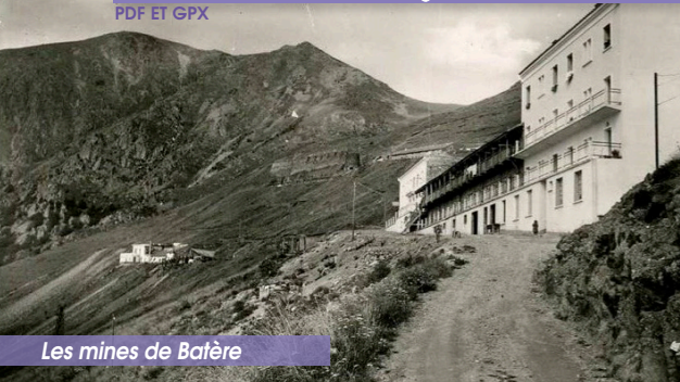
Les mines de Batère