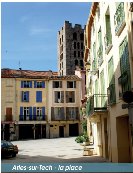
Arles-sur-Tech - la place

Centre Sud Canigó / Can Valent / Stade / Fontaine des Buis (Font del Boix) / Barri d'Amont / Barri d'Avall / Centre Sud Canigó