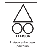
Liaison entre deux parcours