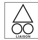
Liaison entre deux parcours