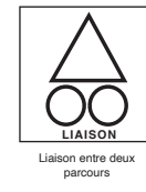
Liaison entre deux parcours